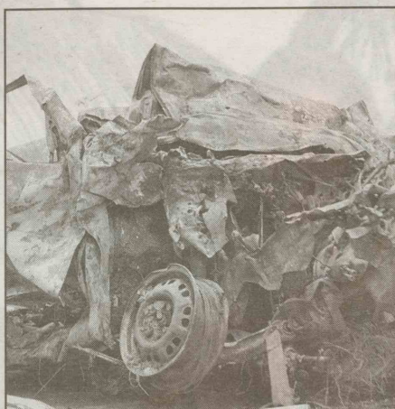
O impacto foi tão violento que o carro pegou fogo