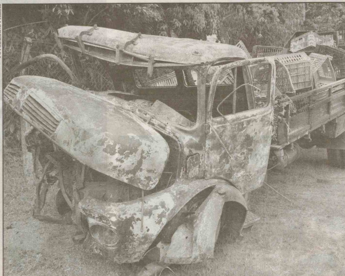
Os ocupantes do caminhão passam bem, apesar de o veículo ter ficado bastante destruído

Peritos criminais compareceram ao local do desastre. Devido ao grau de carbonização, eles não puderam determinar o sexo das vítimas e nem apurar se elas se tratam de crian-