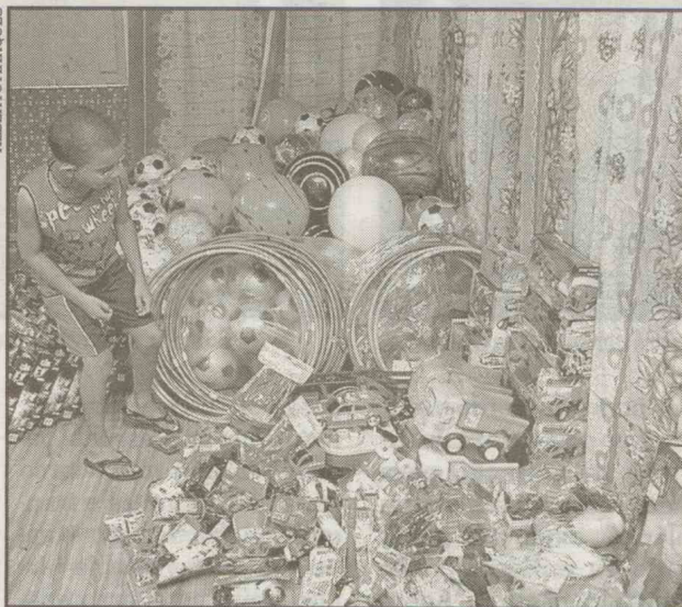
Cerca de 800 crianças receberam brinquedos de presente